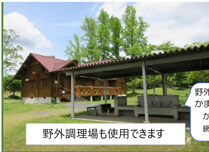
野外調理場も使用できます

野外調理場は六角棟と共有で、 かまどが8つあります。 かまど内寸 36×48 (cm) 網は 45×50 位がオススメ